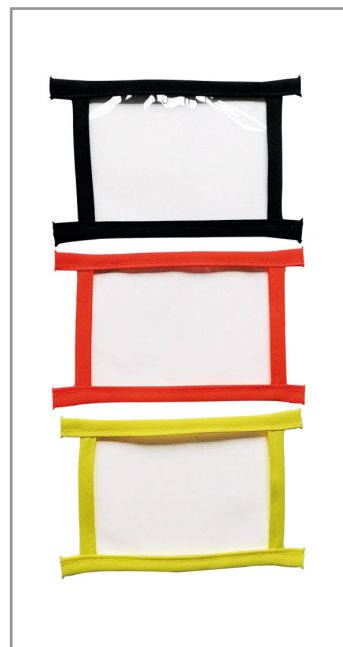
Gelb, Orange und Schwarz Brust B = 10,5 cm x H = 7,5 cm